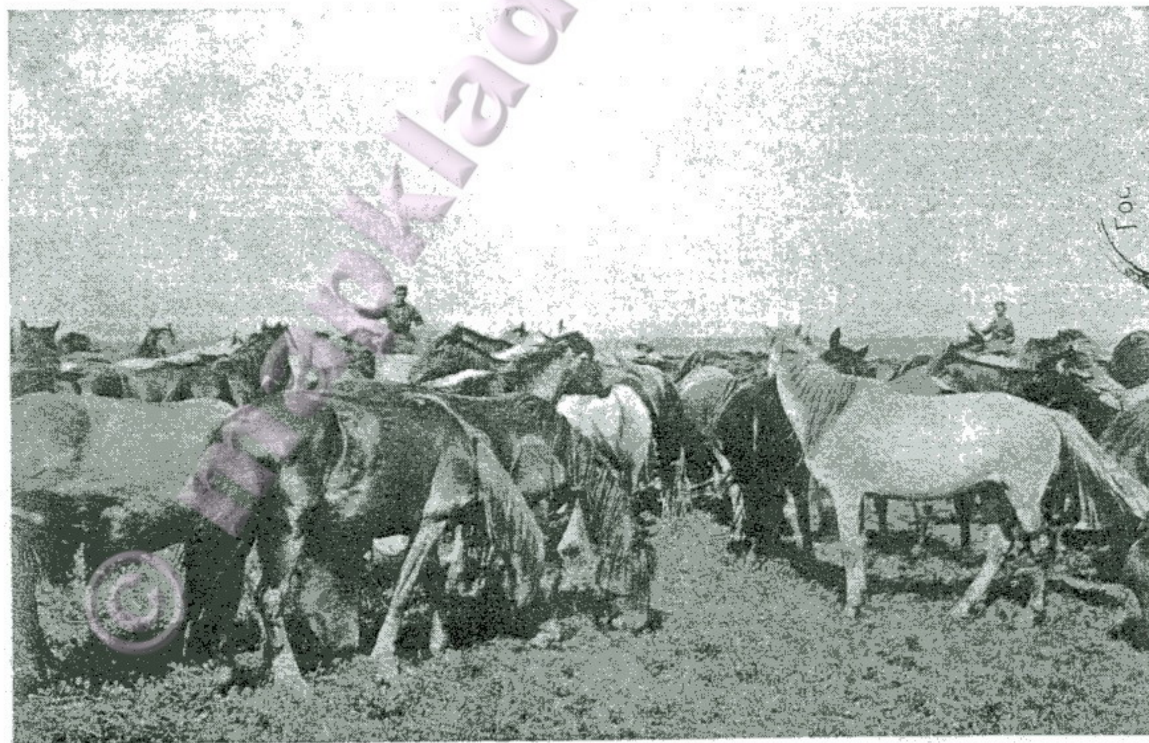
На степной ярмаркѣ. Табунъ киргизскихъ лошадей.