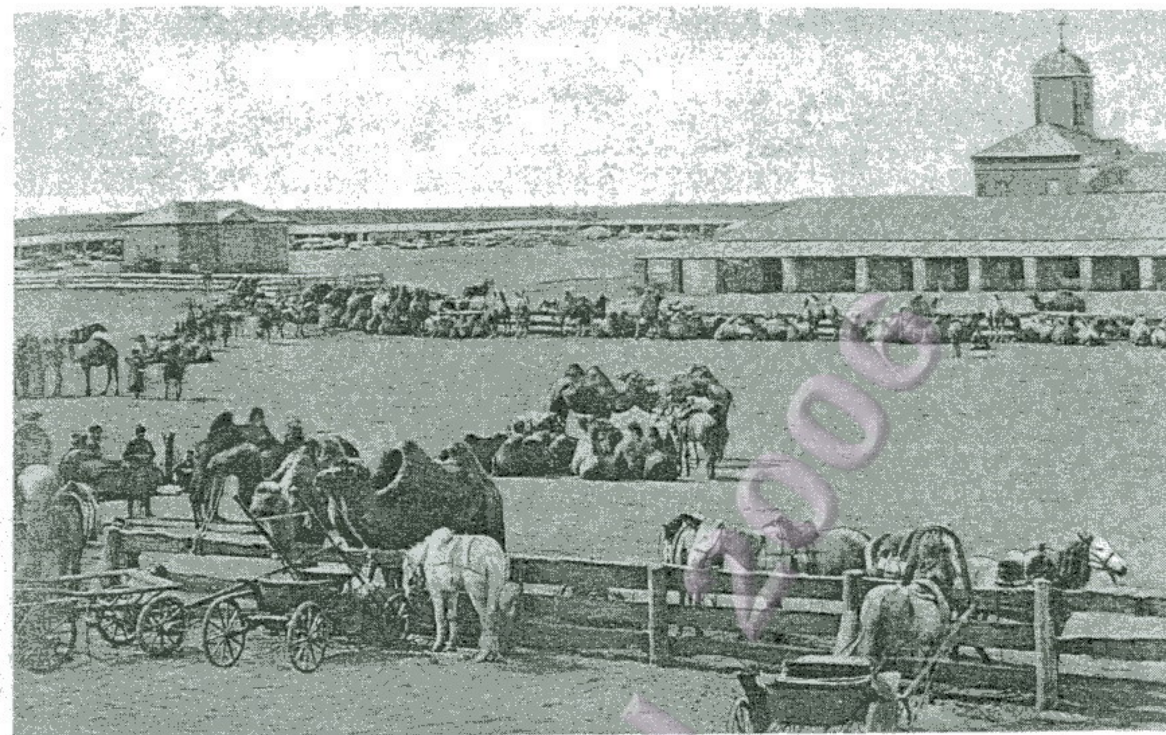
Оренбургъ. Мѣновой дворъ.