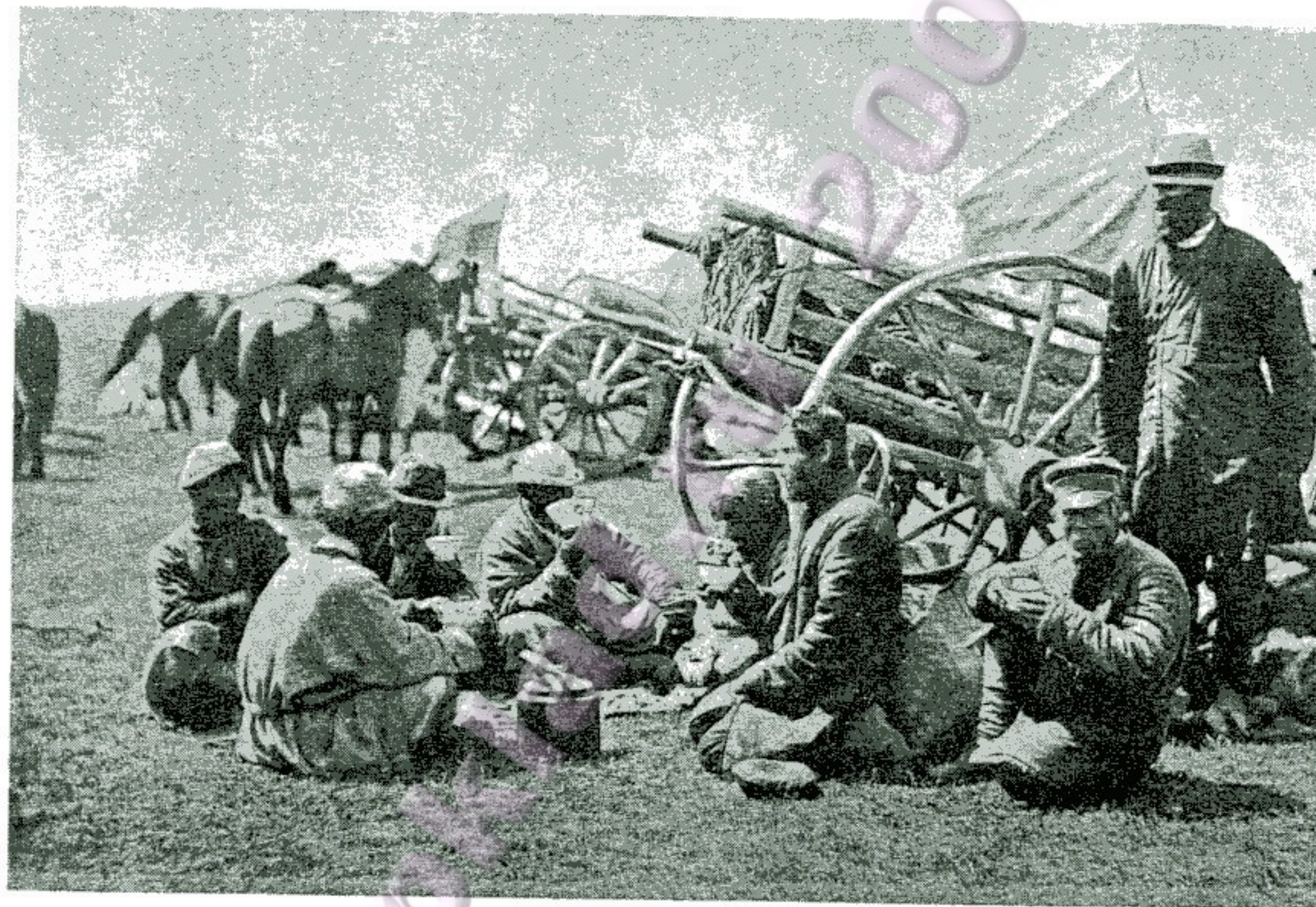
На степной ярмаркѣ въ Атбасарѣ.

Ивановская курганская ярмарка—съ 24 по 30 іюня—самая незначительная по оборотамъ и исключительно конная; лошадей